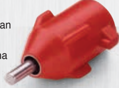
Twin Lock Drinker